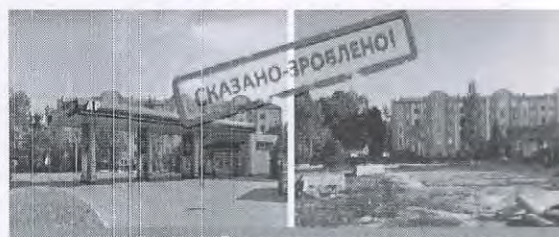
ВПЕРШЕ В УКРАЇНІ ЗНЕСЕНО НЕЗАКОННУ АЗС

Завершено процес демонтажу незаконної автозаправки на вулиці Лемківській, 9 у Львові. За рішенням Вищого Господарського суду України щодо знесення незаконної АЗС, державна виконавча служба Головного територіального управління юстиції у Львівській області забезпечила знесення шляхом демонтажу АЗС. Прибрані ризики для мешканців та відновлено порядок.